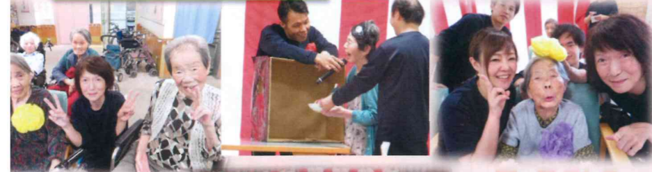
特養・ケアハウス