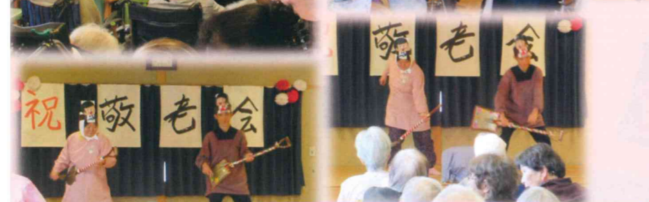
小規模多機能 かこのさと