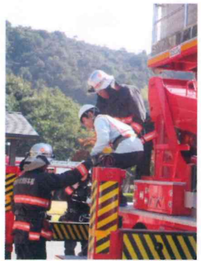
参加された方々は熱心に 取り組んでおられました。