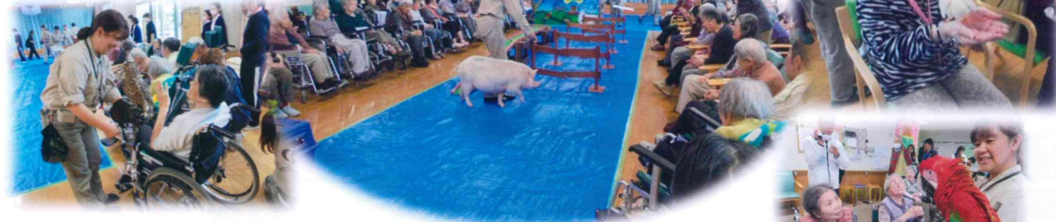
可愛い動物に笑顔が溢れました