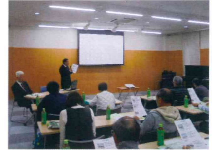
鹿児の郷の取り組みをご説明後 施設内を見学して頂きました。