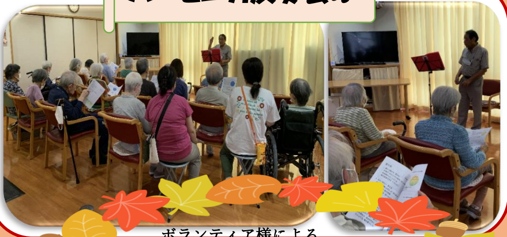
ボランティア様による